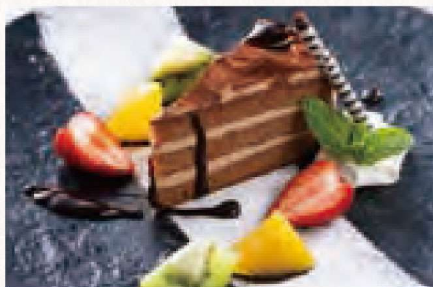
本日のケーキとフルーツ 680円 Today's Cake and Fruit

バナナ・チョコレートからお選びください Please choose between Vanilla or Chocolate