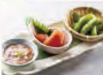
肴盛り合わせ 980円 (イカ塩辛、枝豆、明太子) Assorted Appetizers (Squid Pickled in Salt, Edamame, Mentaiko)