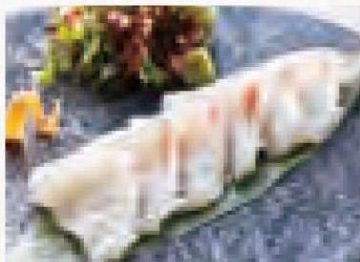
佐世保ブドウ鯛刺し 980円 Sasebo Red Snapper Sashimi