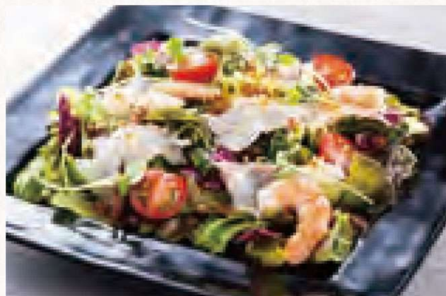
海鮮サラダ 1,280円 Seafood Salad