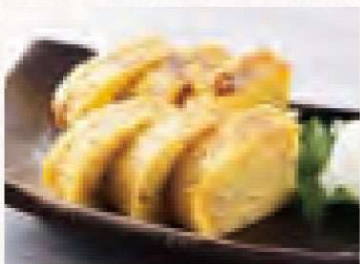
出し巻き玉子 500円 Rolled Omelet