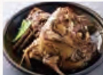
佐世保ブドウ鯛のあら煮 980円 Sasebo Sea Bream Stew