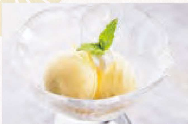
アイスクリーム 450円 Ice Cream