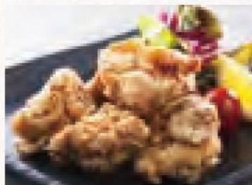
若鶏唐揚げ 780円 Fried Chicken