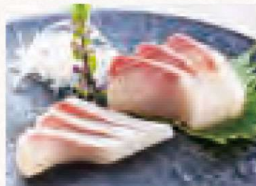
九十九島ヒラマサ刺し 980円 Yellowtail Sashimi from Kujukushima