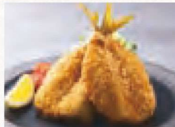
松浦アジフライ 1,180円 (単品) Matsura Horse Mackerel Fry (Single Serving)