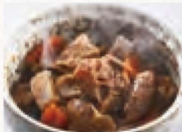
牛すじの煮込み 1,080円 Beef Tendon Stew