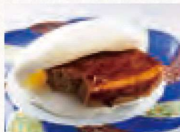
長崎角煮まんじゅう 680円 Nagasaki Braised Pork Bun