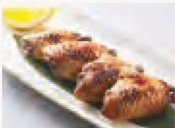
手羽先の一夜干し 1,080円 Dried Chicken Wings