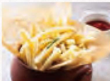
フライドポテト 500円 French Fries