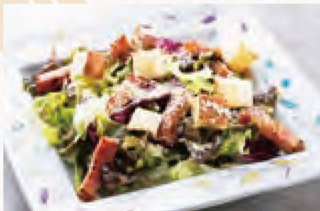
シーザーサラダ 780円 Caesar Salad